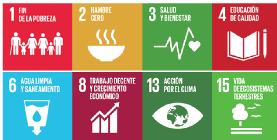
Figura No. 1 ODS vinculados a la SAN