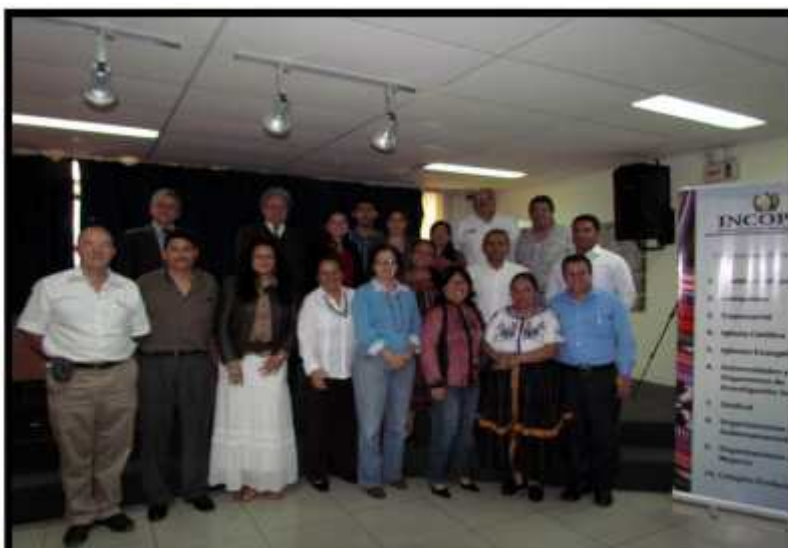
Participantes en el seminario INCOPAS, SESAN y otros sectores

El seminario-taller tuvo como objetivo conocer los diferentes enfoques, técnicas de monitoreo y evaluación en políticas públicas y su aplicación práctica en América Latina así como identificar los principales obstáculos para su implementación. El seminario se realizó los días 20, 21 y 22 de noviembre y estuvo dirigido a representantes de INCOPAS y funcionarios de SESAN.