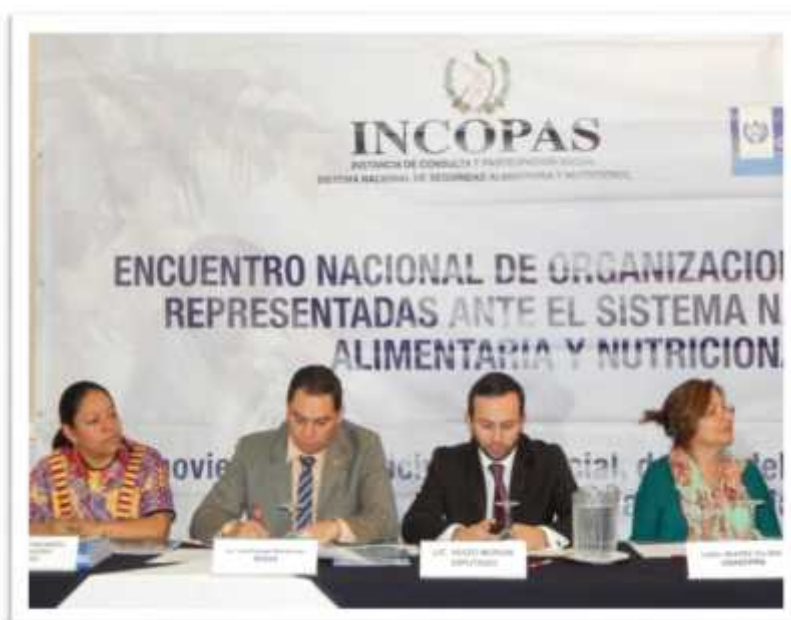
Integrantes de la mesa principal en la inauguración del III Encuentro

Donde participaron 150 personas, entre líderes y lideresas de organizaciones comunitarias de los 10 sectores que integran la Instancia, provenientes de varios departamentos, representantes de los sectores, representantes de organizaciones nacionales e internacionales vinculadas a SAN y con los que se tiene alianzas, autoridades de la SESAN y coordinador del Frente Parlamentario Contra el Hambre, capítulo Guatemala.