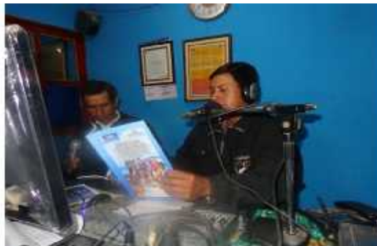
El sector campesino y las radios comunitarias apoyan la divulgación de la Política Nacional de Seguridad Alimentaria y Nutricional y Ley del Sistema Nacional de Seguridad Alimentaria y Nutricional.

El campesino ha tenido limitaciones para el acceso a tierras que cuenten con vocación agrícola para la producción de alimentos, la facilitación de semillas mejoradas, la tecnificación, así como el acceso a créditos, seguros sobre producción que le permitan contribuir a la calidad de alimentos para una buena nutrición a la población.