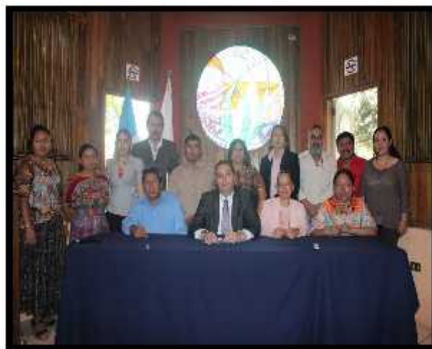
Integrantes de la INCOPAS 2013-2015

La elección de los representantes se realizó el 30 de mayo de 2013 en la ciudad de Guatemala, quedando integrada la INCOPAS por 12 mujeres y 8 hombres, entre titulares y suplentes, delegados de los 10 sectores que la representan, para luego nombrar a 5 delegados al CONASAN.