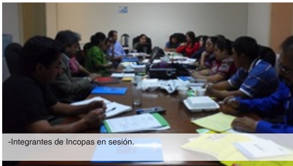
-Integrantes de Incopas en sesión.

Con el objeto de analizar y discutir temas sobre SAN, la Incopas mantiene reuniones entre sus representantes, pues una de sus atribuciones es brindar aportes técnicos al Sistema Nacional de Seguridad Alimentaria y Nutricional. Estructura de Incopas