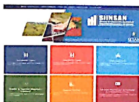
Sistema de Información Nacional de Seguridad Alimentaria y Nutricional SINSAN